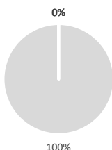
2. Alignement des investissements sur la taxonomie, hors obligations souveraines*